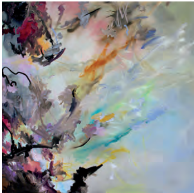
Der Horizont ist eine Illusion 2015 // Öl auf Nessel // 150 x 150 cm