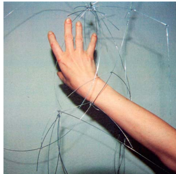
Mobile , Drahtplastik, 2007