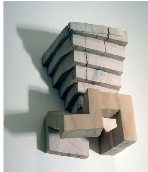
Altan, Linde, 39 x 23 x 19 cm, 2005

2003 Atelierstipendium des Landes Niederösterreich lebt und arbeitet in Wien