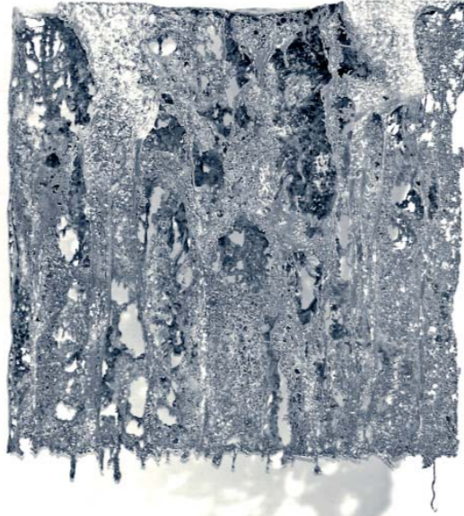
gemaltes_100, 50 x 50 x 10 cm, 2009

lebt und arbeitet in Golberode bei Dresden