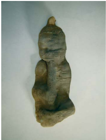
o. T., Terracotta, 38 x 14 cm, 2007