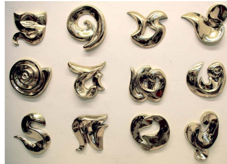
12 Wandplastiken, Messingbronze, je ca. 50 x 12 cm, 2008