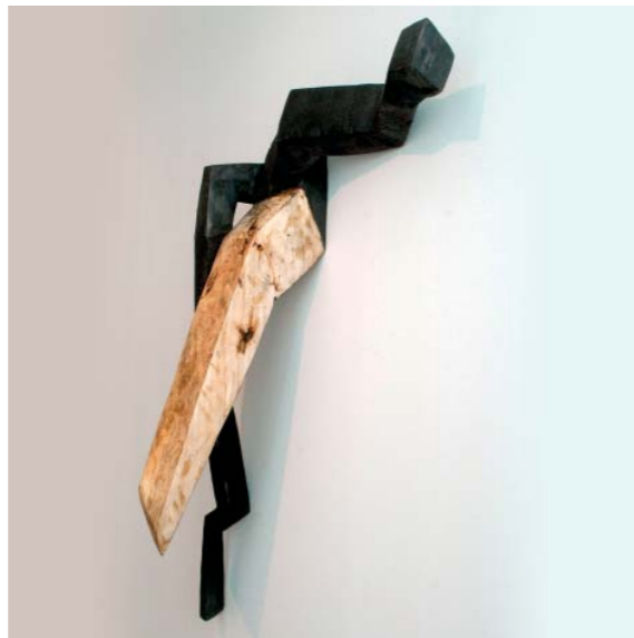
Kreuzdynamik , Pappelholz gebrannt, 98 x 93 x 30 cm, 2007

geöffnet: Mo 10–18 / Di bis Fr 11–18 / Sa 10–15 Uhr